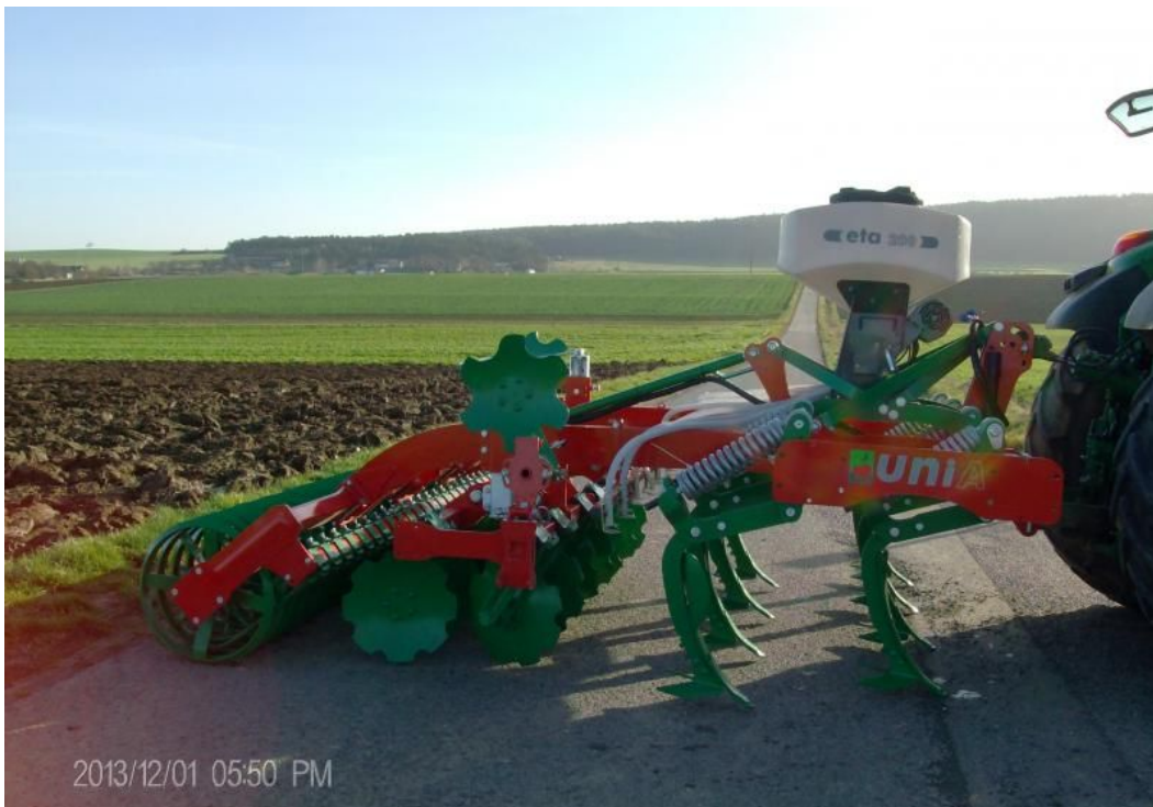
Es handelt sich nur um die Unia Säinheit, unser Güllegrubber ist 3 balkig mit Doppelkrümmlerwalze.

Somit können Zwischenfruchtmischungen exakt ausgebracht werden, außerdem ist eine windunabhängige Saatgutverteilung möglich.